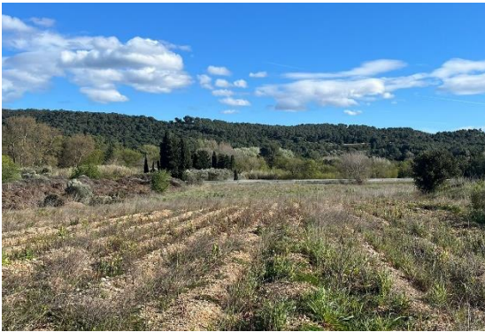
Figure 4 : Photo de la parcelle 2