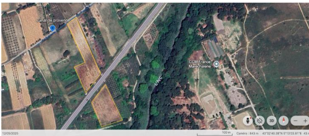
Figure 5 : Vue satellite de la parcelle 2

La parcelle cerbottanie 2 est une parcelle en pente actuellement en jachère d'une surface totale d'1.15 hectares. Pour cette parcelle, une plantation dans le sens de la longueur est largement préférable car celui-ci se trouve sur l'axe Nord-Sud. Cette parcelle est séparée en 2 parties par une voie rapide.