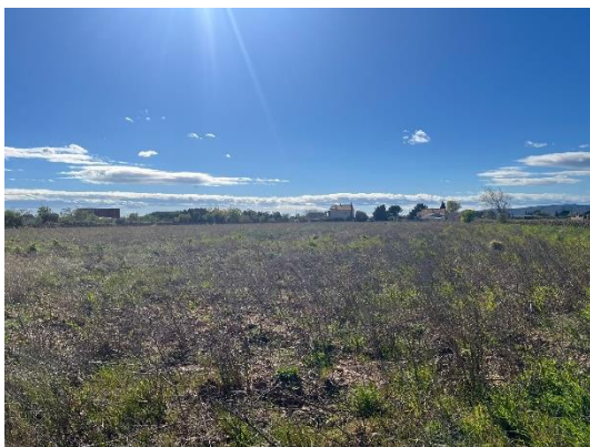
Figure 1 : Photo de la parcelle 1