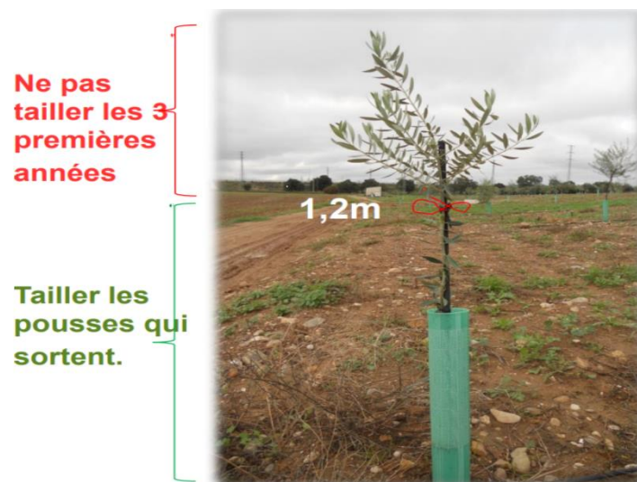
Figure 7 : Taille d'un jeune plant d'olivier

Il faut 3 ans pour avoir une première entrée en production des oliviers pendant cette période les oliviers demandent peu de travail. Une des étapes clés de ce mode de conduite est la taille pour conformer les arbres afin que les travaux soient mécanisables. La taille se fait en avril et manuellement les trois premières années avec pour objectif d'obtenir le rapport feuille/bois doit toujours être le plus élevé possible, il n'est taillé que les pousses inférieures à 1,20 m sur le tronc, comme sur l'image ci-dessous. (Taille de L'olivier En Intensif et Haie, 2023)