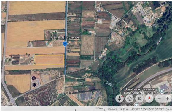
Figure 2 : Vue satellite de la parcelle 1